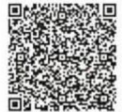
Solicitação do Jido Club