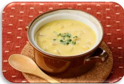
Sopa cremosa de abóbora