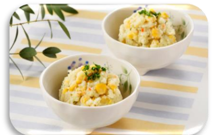
Salada de maionese

Inscrição: (entre os dias 5 e 19 de janeiro)