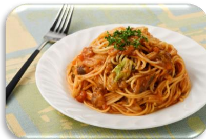
Macarrão ao molho de tomate