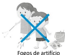
Fogos de artifício