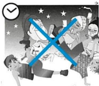
Agitação (som alto etc.)