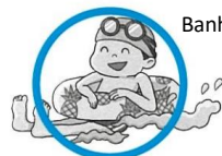
Banho de mar

Contatos: ①②③... 4º andar da Prefeitura de Nishio, no Setor de Promoção Cultural e Turismo – ☎0563-65-2169 ④...Setor de Promoção da ilha Sakushima – ☎0563-72-9607