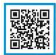
Mapa da feira de Isshiki

Horário ... 5h às 8h ※Fechado todas as segundas e quartas-feiras.