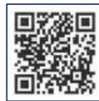
Conta oficial da cidade de Nishio LINE