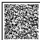
Mapa de localização