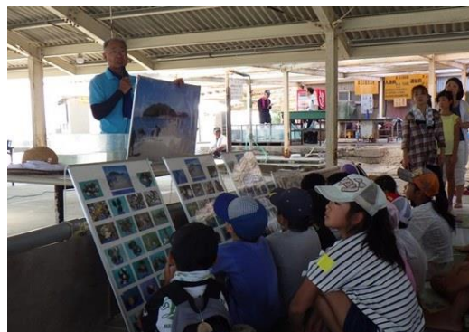
▲干潟についての説明を聴く参加者