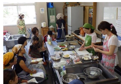
▲第4回 エコ・クッキング教室