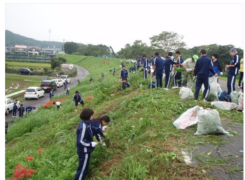
▲矢作古川クリーン作戦