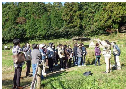
▲里山の自然について説明を聴く受講者