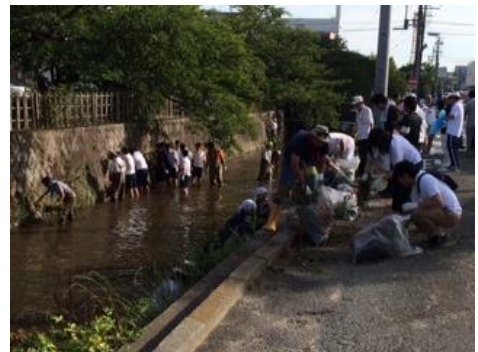
▲みどり川クリーン作戦