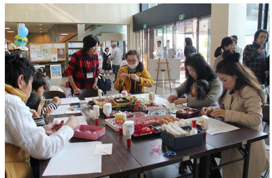
▲リサイクル作品の講習会