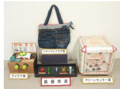
▲小学生のリサイクル作品