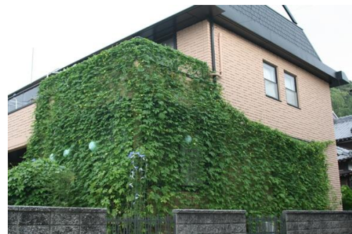
▲緑のカーテンコンテスト優秀作品