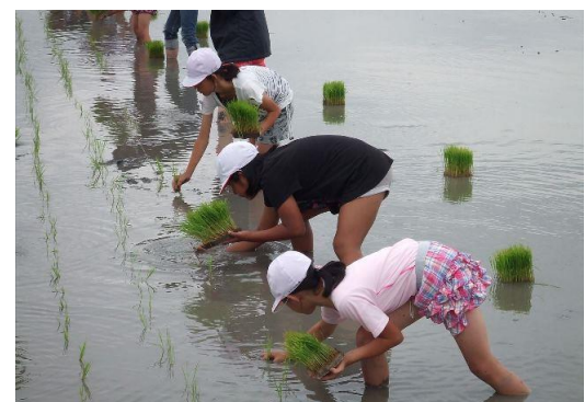
▲田植えを体験する小学生児童たち