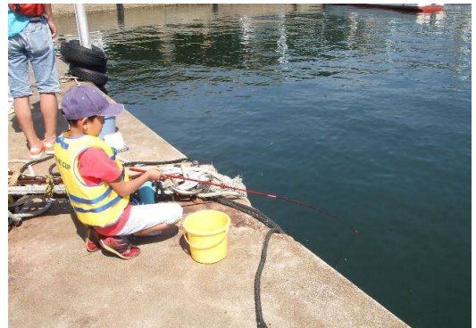
▲ハゼ釣り体験をする参加者