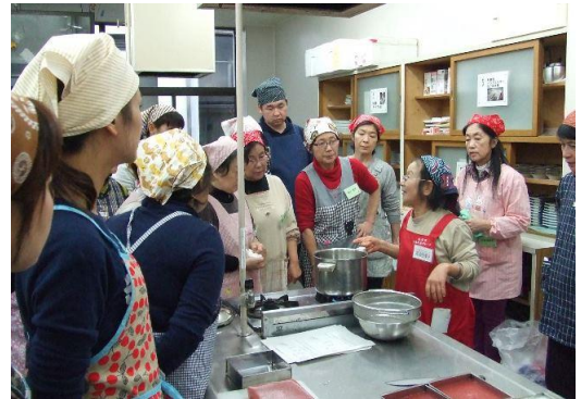
▲講師の話を熱心に聴く参加者