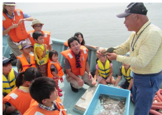
▲水揚げされた魚介類の説明を聴く参加者