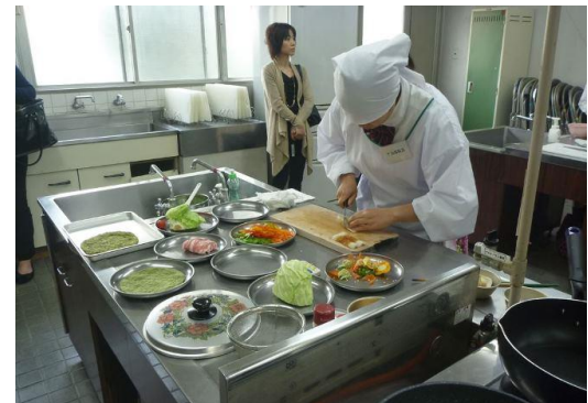
▲米粉を使った料理をつくる参加者