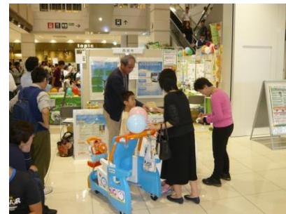
▲市内ショッピングセンターでの廃油せっけん配布

にしお環境市民塾及び西尾市生活学校が廃食用油を原料としたせっけんやアクリルたわしをつくり、水質浄化イベントなどで市民に配布。