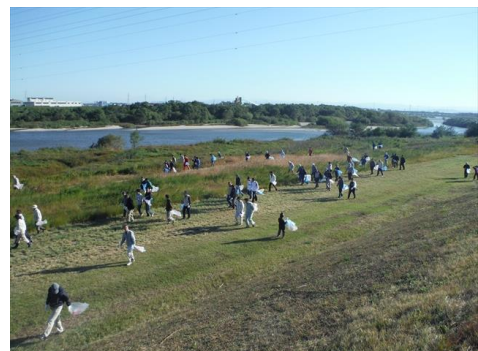
▲川と海のクリーン大作戦