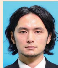
てかりやムラがあるもの