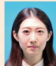
つげまつげ、まつげエクステの影