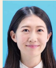
口角が上がるなどにより実際の容姿と著しく異なるもの