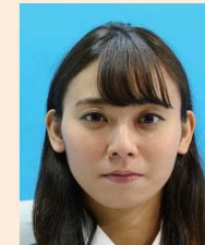
背景に異物が写りこんでいるもの