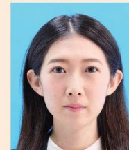
変形やマスキングなどの画像処理をほどこしたもの