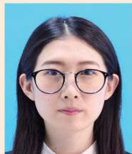
眼鏡のフレームが目にかかっているもの