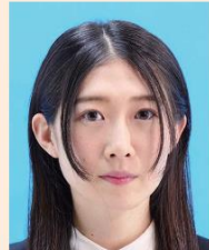
髪が目にかかっているもの