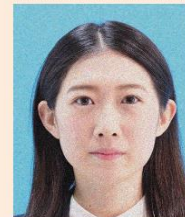
ノイズ(画像の乱れ)があるもの

デジタル画像の過剰な圧縮などが原因となってノイズ(画像の乱れ)が発生しているものや、ジャギー(階段状のギザギザ模様)、印刷時のドット(網状の点)やインクのにじみがあるものは不適当です。写真専用の用紙を使用し、鮮明な画質で印刷してください。