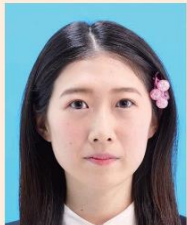
装飾品で目・耳・鼻・唇などが隠れているもの