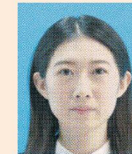
ドット(網状の点)やインクのにじみがあるもの