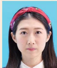
帽子やヘアバンドなどにより顔の一部が隠れているもの