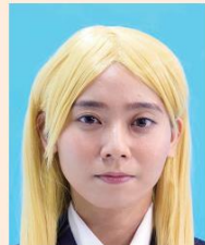
カツラ(ウィッグ)などにより実際の容姿や雰囲気が変わるもの