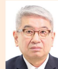
頭、髪、服装等と背景の境界が不明瞭なもの