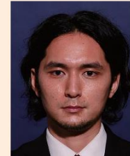
背景の色が濃いもの