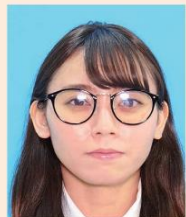
照明が眼鏡に反射したもの