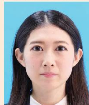
目を大きくしたり、顔のパーツが変形したもの

目を大きく見せたり、美白処理、顔パーツをほくろ、しわなどを修正するなどして、本人のイメージを変えることは、いかなる場合でも不適当です。また、左右反転した写真は不適当です。