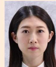
背景が柄模様であったり、凹凸のあるクロスが写りこんでいるもの