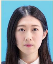
顔の輪郭が隠れるもの