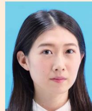
横を向いているもの