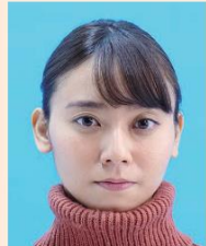
タートルネック、パーカーのフード、首を覆うもの、衣服などにより顔などの顔の一部が隠れているもの