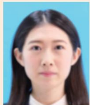
ピンぼけや手ぶれにより不鮮明なもの

撮影時にピントが合っていないか、手ぶれしてしまったため不鮮明なものや、顔にばかりやムラがあるものは不適当です。