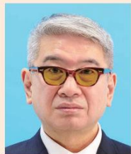
色付きの眼鏡やサングラス

より確実な本人確認のため、眼鏡を外した顔写真を推奨します。眼鏡を着用するとき、色付きのレンズや反射・影があるものは不適当です。また、目を妨げる縁・フレームがないものに限ります。医療上必要とされない限り、サングラスや処方のない色付きの眼鏡は不適当です。