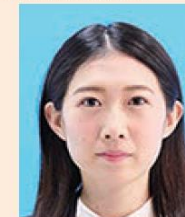
ジャギー(階段状のギザギザ模様)があるもの