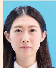
位置が片寄っているもの