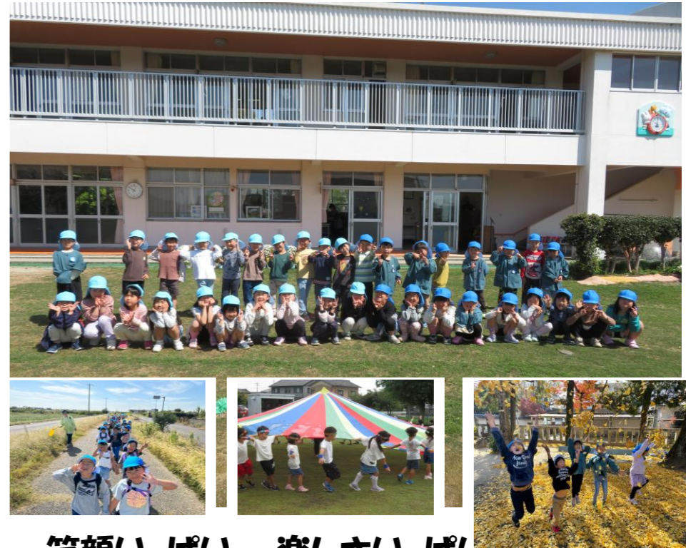
笑顔いっぱい 楽しさいっぱい 荻原っ子！