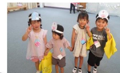
縁日ごっこ 大きい組の子が 優しく誘導してくれます