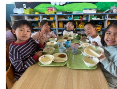
友達と食べる給食おいしいね