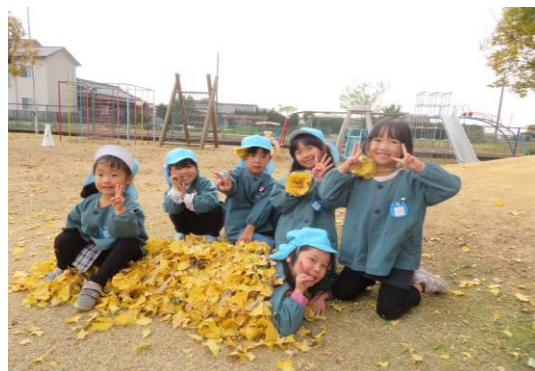
園庭の落ち葉で遊んだよ