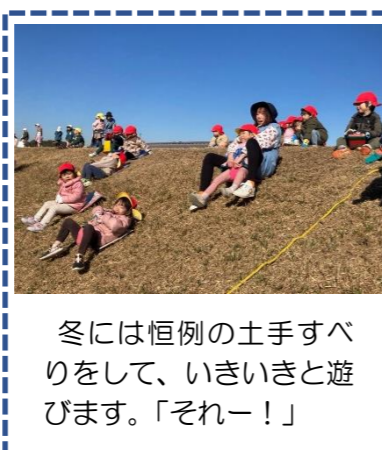
冬には恒例の土手すべりをして、いきいきと遊びます。「それー！」