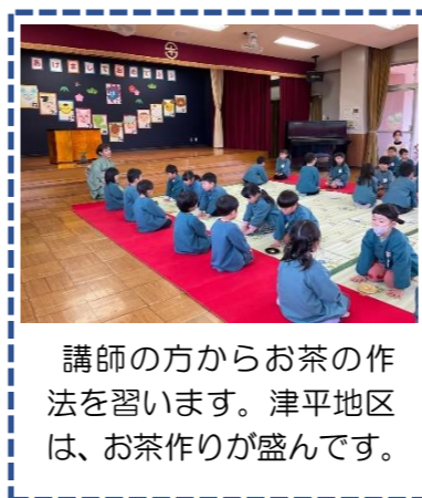
講師の方からお茶の作法を習います。津平地区は、お茶作りが盛んです。