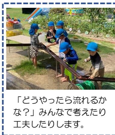
「どうやったら流れるかな？」みんなで考えたり工夫したりします。