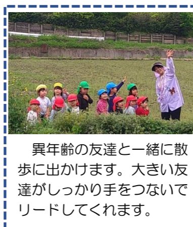
異年齢の友達と一緒に散歩に出かけます。大きい友達がしっかり手をつないでリードしてくれます。