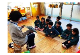
読み聞かせボランティア