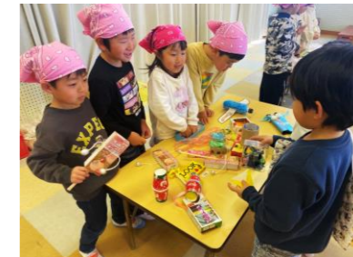
【お店屋さんごっこ】