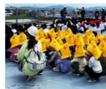
小学校と合同避難訓練

災害の時の被害を最小限にするために、地域、小学校と連携を取りながら、子ども達と一緒に安全について考え、訓練を行っています。