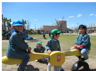
公民館の子どもの広場へ散歩に出かけ遊んでいます。