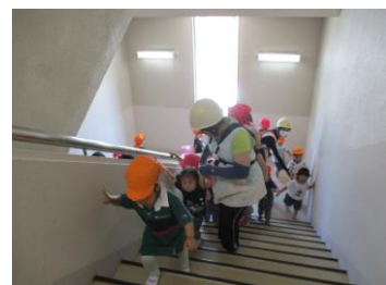
津波を想定した公民館合同避難