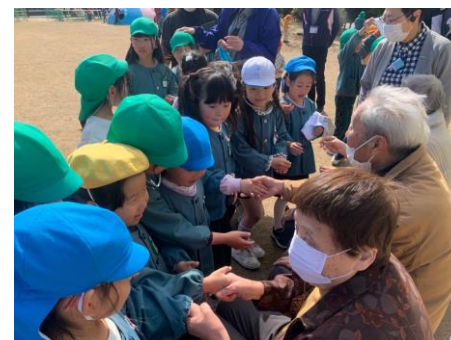
デイサービスの方との触れ合い