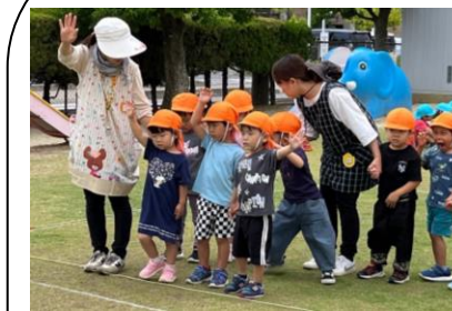
交通安全教室!! 右見て左見て

<12月> 保育発表会(年少児) クリスマス会 <1月> 個別懇談会 (3歳児希望者・4, 5歳児全員) <2月> 節分 入園前健康診断 お招きお茶会(年長児) <3月> ひなまつり お別れ会 卒園式