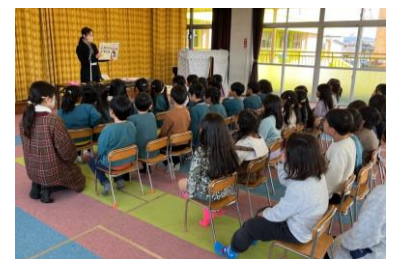
誕生日会・身体測定・避難訓練 交通安全指導は毎月行っています。 不審者訓練は年4回、保護者の引き渡し訓練も年1回実施しています。