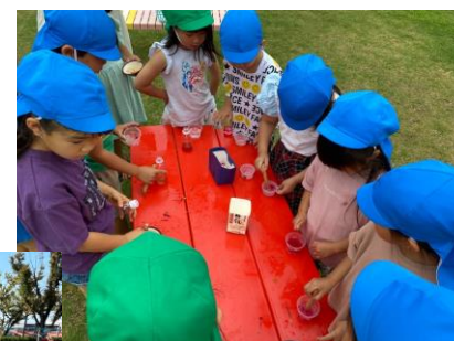
あさがおで色水作り