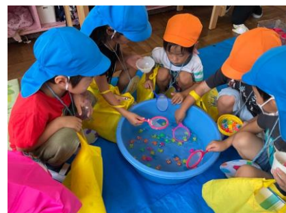
縁日ごっこでは、お兄さんお姉さんと一緒にお店を回ります。

異年齢の関わりや地域の人との触れ合いを通して、優しさや思いやりの気持ちの育ちを大切にしながら、保育をすすめています。