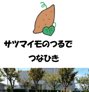
サツマイモのつるで つなひき