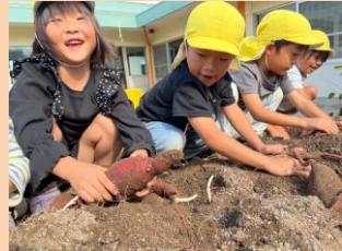
うんとこしょ！芋ほり楽しいな