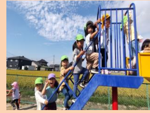
ともだちといっばい遊ぶよ！