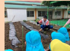
「野菜の先生」からさつまいもの苗差しを 教えてもらいます。