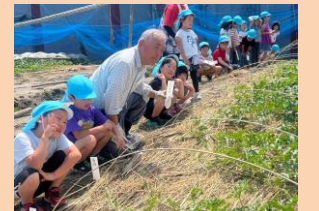
地域の方の畑ですいかの苗に名札 をつけます。大きくな～れ！