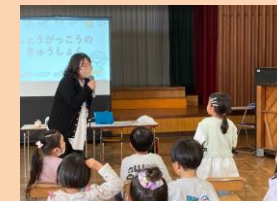
小学校教諭による出前授業

◎作物収穫等を通して、地域の方とのふれあいを深めています。今年度は福地地区に伝わる「わた」作りについて福地南部小学校生との交流を深めていきます。また様々な行事等で小学校教諭と連携を図り、切れ目ない子どもへの支援ができるようにしていきます。