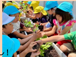
ゴーヤの苗差し！ 立派なグリーンカーテンになってね！