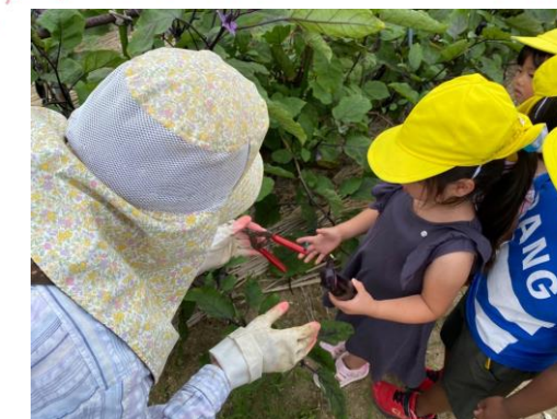
近隣の方の畑で野菜の収穫