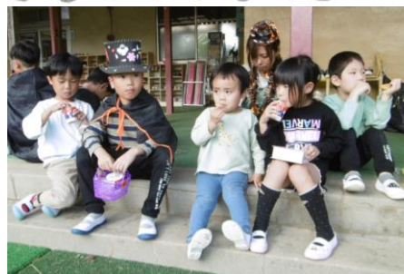
おやつ交流(ハロウィン)

園舎奥には中庭があります。野菜を育てたり、虫を捕まえたりしてのびのび遊んでいます。