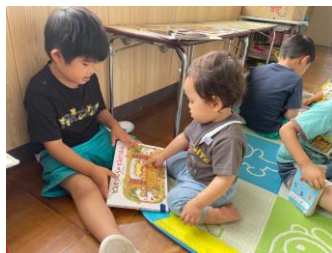
♡ お兄ちゃんと一緒に ♡