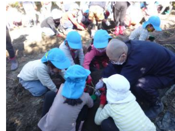
♡ 芋ほり ♡ 地域の方の畑を借りて芋ほり体験