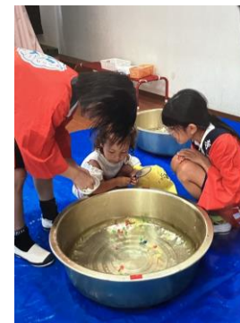
♡ 縁日ごっこ ♡ 小学生がボランティアでお手伝いしてくれました