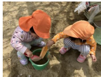
♡ 砂遊び ♡