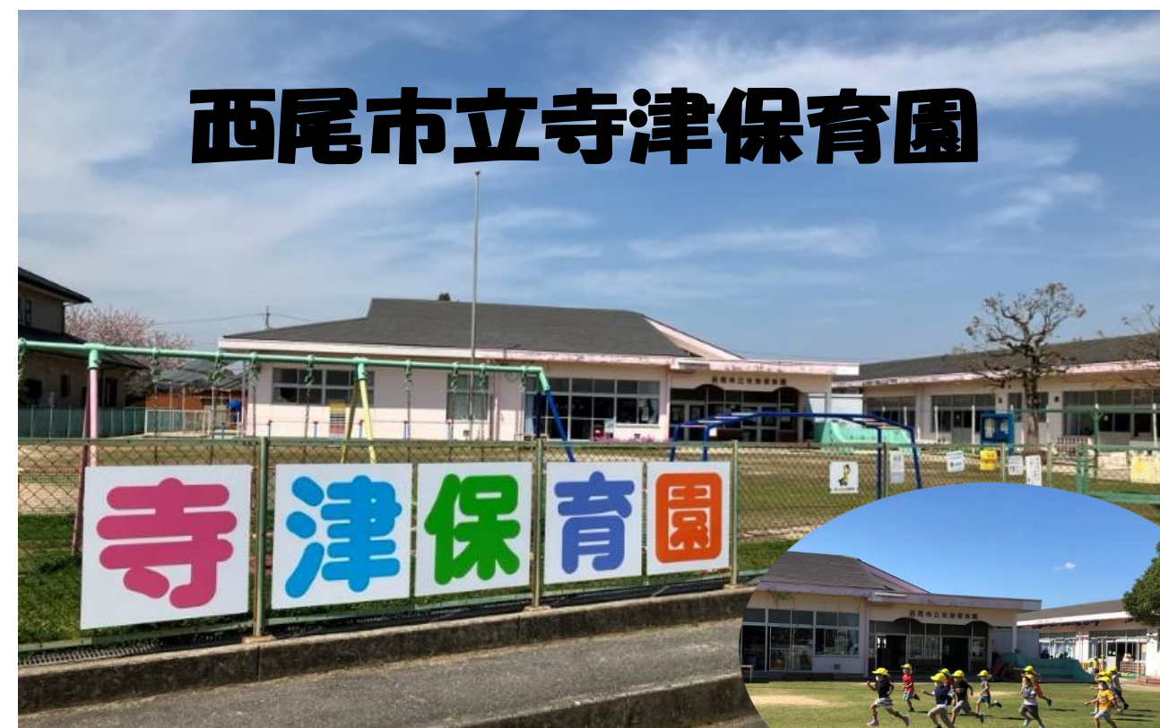
大地を踏みしめ、パワー全開寺津っ子!!

園長 1名 主任 2名 保育士 32名 調理員 5名 看護師 1名 事務 2名 保育補助 1名 計 44名