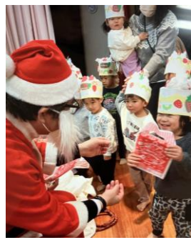
♡ クリスマス会 ♡